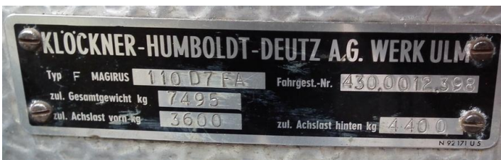
DSCF5326 Tabliczka znamionowa