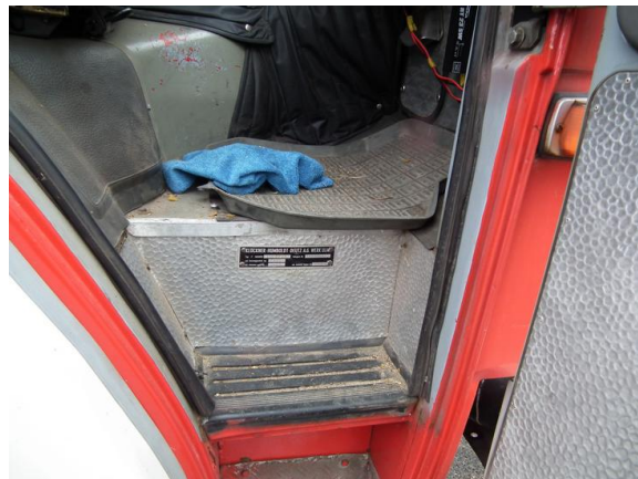
DSCF5327 Umieszczenie tabliczki znamionowej