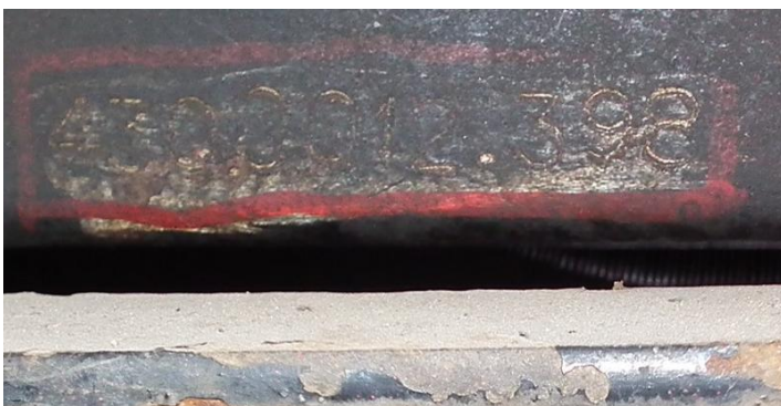
DSCF5329 Numer ewidencyjny na ramie samochodu