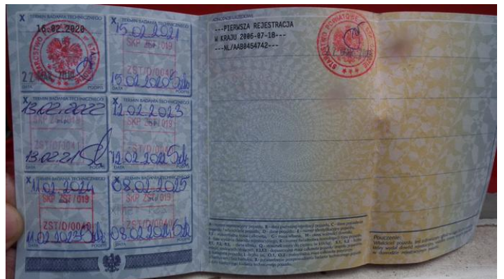
DSCF5316 Dowód rejestracyjny