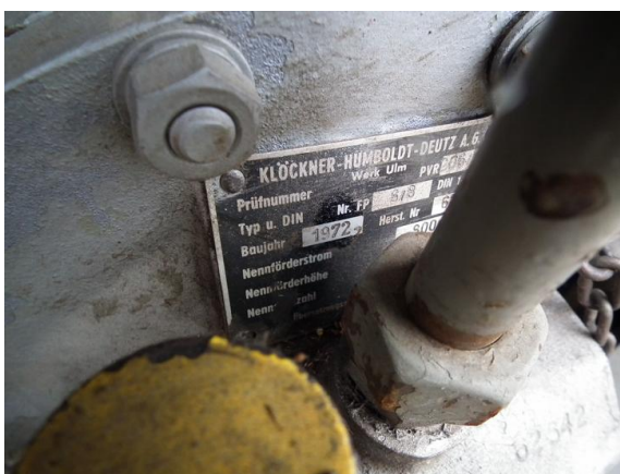
DSCF5353 Tabliczka autopompy typ FP 8/8