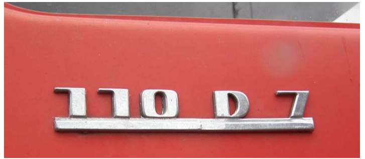
DSCF5324 Model samochodu 110 D 7