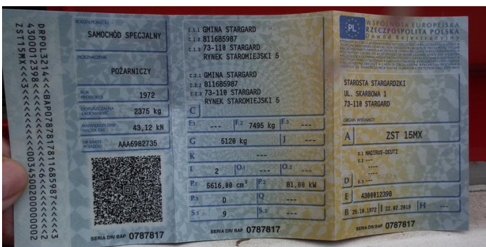
DSCF5314 Dowód rejestracyjny