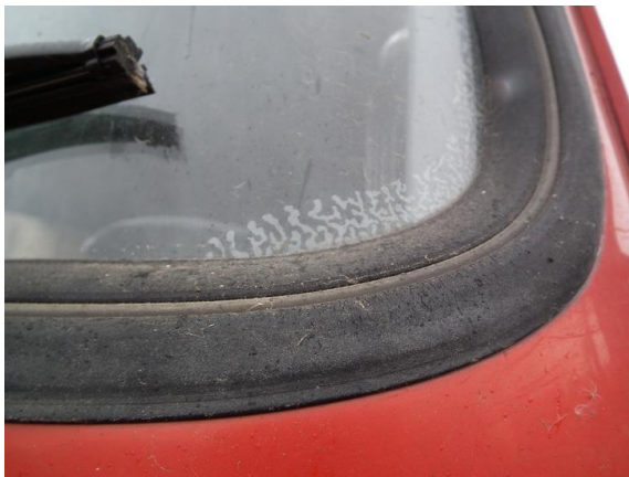
DSCF5364 Rozwarstwianie szyby czołowej